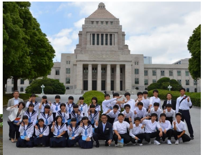
国会議事堂を背景に（3の4）

1日目は、国会議事堂を訪れ、衆議院を参観しました。午後からは、ディズニーリゾートへ。異国情緒いっぱいの夢の国ディズニーシーで、班のメンバーと一緒に夕食まで楽しい時間を過ごすことができました。